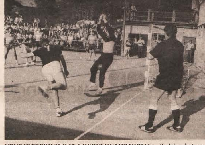
NEURJE PREKINILO 15. LOVREKOV MEMORIAL — Zadnje soboto so se številni ljubitelji rokmeta v Sevnici lahko prepričali, kako nujno bi v Sevnici potrebovali športno dvorano. Močno neurje z dežjem je namreč prekinilo po štirih odigranih tekmah jubilejni Lovrekov memorial. Igralci Dinos Slovana so vseeno prikazali največ, zagrebški drugoligaš Borac, trboveljski Rudar in domačini pa so se enakovredno kosali. Na sliki: Svažič s krila proti Borcu.