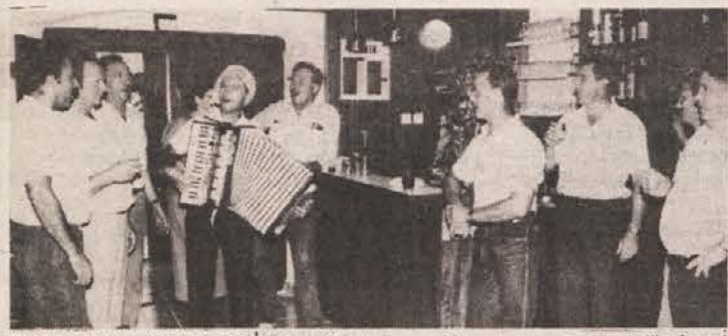
JANEZOVA KLET ODPRTA — V petek popoldne so se za goste prvič odprla vrata Janezove kleti na Trški gori...