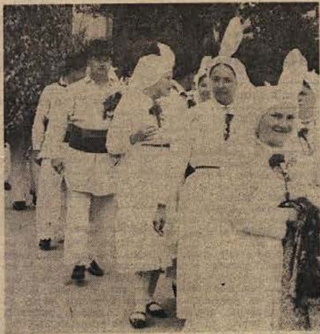
Na stotine narodnih nož bo 20. in 21. junija spet preplavilo Črnomelj. Folklorne skupine iz Bele krajine se vneto pripravljajo za nastop na jurjevanju in kresovanju, saj imajo vsako leto več gledalcev.

Na Kolpi so odlični pogoji za razvoj ribiškega turizma. Veliko škoda naredijo tudi krivolovci, ki jih ob Kolpi ni malo. Ribiška družina ima zaenkrat premalo denarja, da bi lahko plačevala stalnega čuvaja, ki bi pazil na krivolovce.