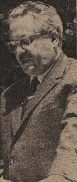
Edvard Kardelj med go- vorom v Dol. Toplicah