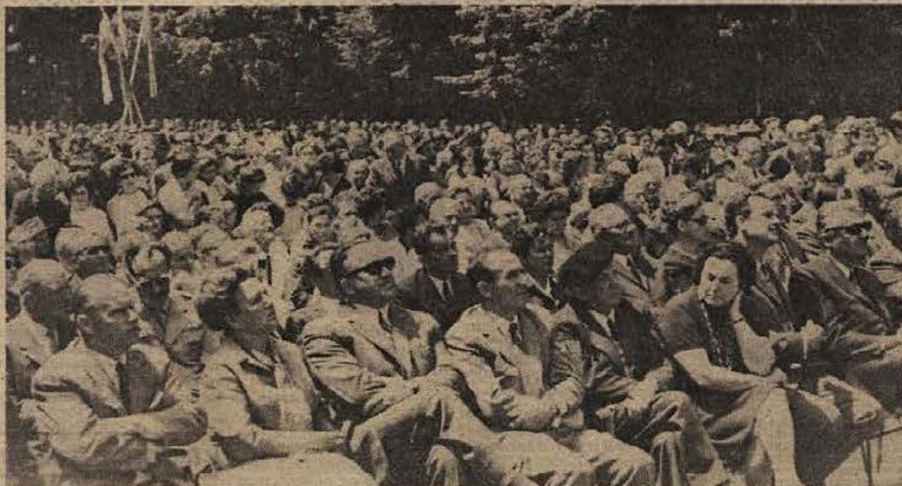
Dolenjske Toplice so v nedeljo doživele veličastno slavo. Več kot 15.000 ljudi je prišlo na veliko srečanje aktivistov, na katerem je govoril Edvard Kardelj.

14. junija ob 11. uri dopoldne bo na novomeškem stadionu »Bratstva in enotnosti« slovensko tekmovalje ekip prve pomoči. 34 ekip, ki so zmagale na občinskih tekmovanjih, se bo pomerilo v znanju in pripravljenosti nudenja prve pomoči. Nastopili bodo 204 tekmovalci. Po tekmovanju bo še zanimiva ogledna vaja, v kateri bodo sodelovali odredi prve pomoči RK iz Ljubljane ter gasilci, sanitetne enote in kirurška ekipa prve pomoči iz Novega mesta. Vaja bo prikazovala požar in reševanje iz gorečih stavb v bližini stadiona.