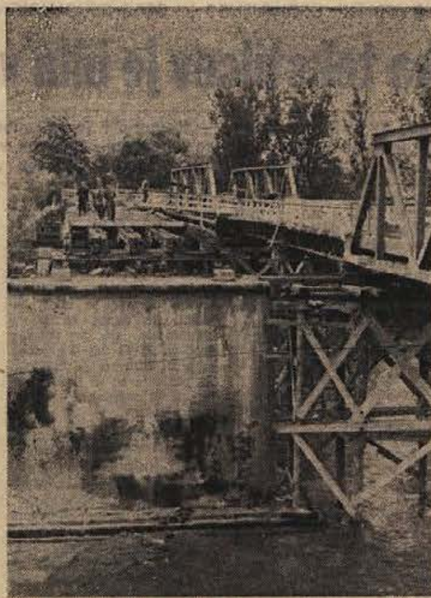
Dva mosta v Metliki! Na starih temeljih gradi podjetje Tehnogradnja nov most, ki bo širok 10,9 m. Da bi šli lahko pešci in vozovi do 2 toni še na Hrvaško in obratno, so stari del mosta dvignili in ga na vozčkih prepeljali 10 m vstran.