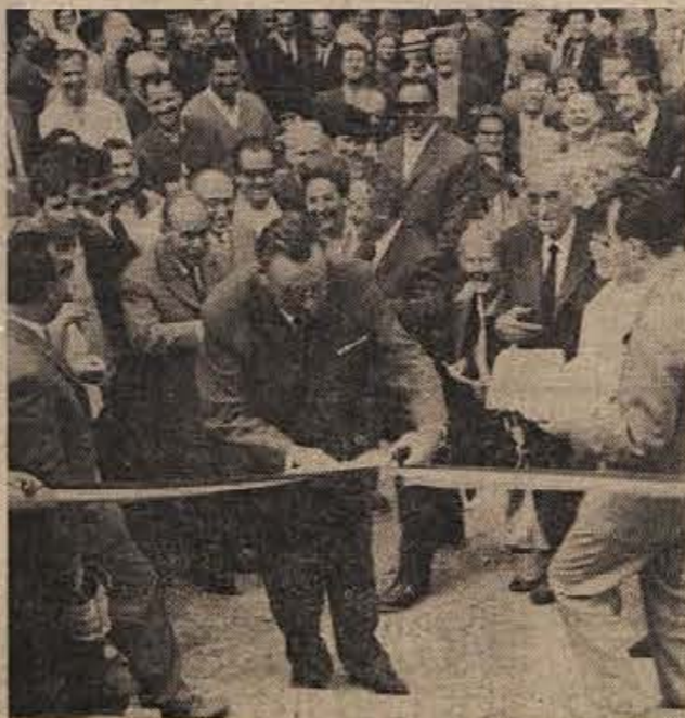
Franc Leskošek-Luka je na Bazi 20 odprl novo brunarico. Sodiijo, da bo po selje prišlo na partizanski Rog še več obiskovalcev iz vseh krajev nase domovine in tudi tujih turistov.