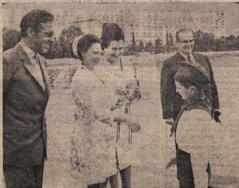
SLOVO OD PRINCESE MARGARETE — Po dvodnevem bivanju na Brionih je britanska princesa Margareta, ki se je z možem, lordom Snowdonom (desno od nje), mudila v Jugoslaviji osem dni, odpotovala iz Jugoslavije. Ob slovesu je prejela šopek cvetlic od pionirja. Princesa Margareta in lord Snowdon sta bila v Jugoslaviji gosta predsednika republike.