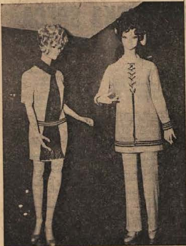
Priznana tovarna pletenin RASICA iz Ljubljane je tudi letos na sejmu »Moda 70« prsenetila z modeli in izbiro barv