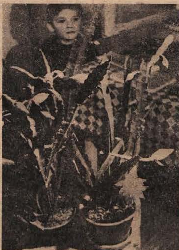
POZIMI KAKTUSI CVETO — nekoliko nevsakdanje, vendar že več let pri Reckovih v Partizanski ulici v Novem mestu okoli novoga leta cvetijo kaktusi. 3-letni semenjak Cooperjeve vzgoje je letos imel 65 cvetov, kar je precej nenavadno. Sredi poletja imajo kaktusi samo kakšen osamljen cvet, pozimi pa se pokažejo v vsej svoji lepoti.