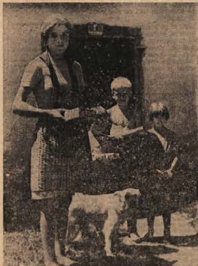
Vidrihovi otroci so prestrašeno opazovali tuje, bolj skrbne kot so njihovi starši, ki so jih nepreskrbljene pustili brez toplega družinskega zavetja. Niso osamljeni primeri, da otroci v jeseni življenja zapustijo svoje zgarane starše, redkeje pa so drame podobne Vidrihovi.

Eni trdijo, da življenje piše drame, drugi pa, da se jih izmišljajo pisatelji. Dramo po dolenjskih gričih, v odročnih in zaostalih krajih pa piše resnično življenje. V teh pretresljivih dramah v glavnem nastopajo starejši ljudje, mlade, ki so ostali doma, lahko preštejemo na prste. Izhoda zanje ni! Zato zapuščajo to zemljo, prepreno z znojem njihovih staršev. Morda o teh kdaj drugič.