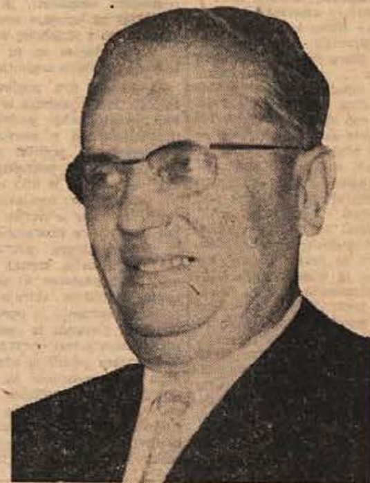
PREDSEDNIK TITO V NOVOLETNI POSLANICI:

Delovni kolektiv ribniške kovinske industrije RIKO je 27. decembra proslavil 15-letnico obstoja. Hkrati so proslavili tudi posebno pomemben uspeh — poslovno leto 1969 so zaključili tako, da so prvič v svoji zgodovini dosegli proizvodnjo nad milijardo starih dinarjev oziroma 10 milijonov novih din. Več o slavlju in zgodovini podjetja bomo poročali prihodnjic.