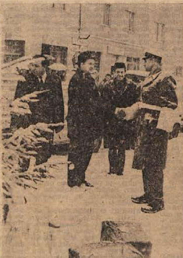
Na starega leta dan so bili prvič organizirano obdarovani tudi kočevski miličniki. Ob 10. uri je na križišču pri spomeniku ustavila kolona osebnih avtomobilov, predstavniki občinske skupščine, družbeno-političnih organizacij in podjetij pa so polagali pod smrečico darila in čestitali službujočemu miličniku.