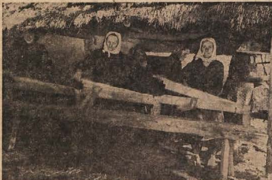
V Sloveniji se je med ljudstvom ohranilo veliko običajev, ki jih preslabo vključujemo v turistično ponudbo. Ohranila so se razna domača opravila, ki bi bila zanimiva tudi za turiste, če bi jih organizirano prikazovali. Na sliki: trtje lanu na starinski način.

Eden od načinov učinkovite zaščite stare ljudske arhitekture je prenos te arhitekture v muzej. To je muzej posebne vrste, muzej na prostem. V Sloveniji imamo že dva manjša muzeja na prostem, enega v Skofji Loki, drugega na Muljavi. Oba prikazujeta arhitekturo svojega ožjega območja. Slovenski muzej je pripravila načrt za naš osrednji muzej na prostem, za Slovenijo v malem, in to ob gradu Podsmreka pri Višnji gori. Po projektu bo tu stalo nad trideset različnih objektov. V prekmurski hiši bo delal in prodajal svoje izdelke lončar, v štajerski zidanci bo kmečka gostilna, v hiši iz okolice Ribnice bo delal suhorobar. Vse to naj bi nastalo v petih do šestih letih.