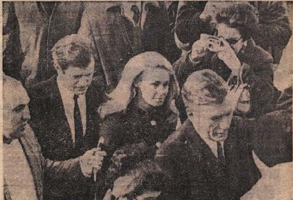
EDWARD KENNEDY NA OBRAVNAVI — Po dolgih pripravah se je v amerškem mestecu Edgartownu v državi Massachusetts začela obravnava o smrti mlade Jo Kopechne, ki je utonila, ko je lani avto Edwarda Kennedyja zdrsil z mosta v jezero. Jo Kopechne se je peljala v avtu skupaj s Kennedyjem, ki mu je ta nesreča precej politično škodila. Kennedy je prišel na obravnavo z ženo Joan v upanju, da bo »ta obravnava zadnja in da se bo lahko odslej nemoteno posvetil delu v amerškem senatu«. Zanimanje za obravnavo je zelo veliko.

Morda kaže posebej omeniti, da je predviden drugačen način financiranja repu-