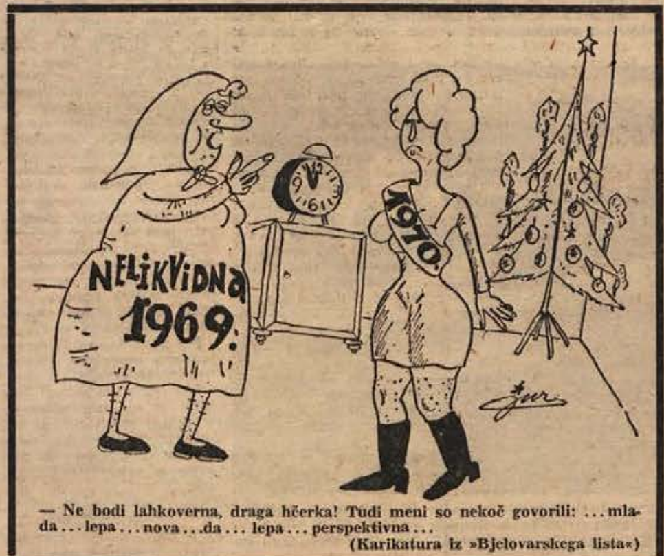
— Ne bodi lahkoverna, draga hčerka! Tudi meni so nekoč govorili: ... mlada ... lepa ... nova ... da ... lepa ... perspektivna ... (Karikatura iz »Bjelovarskega lista«)

V prvem polletju 1970 pričakujemo strokovnjaki nadaljnje naraščanje našega izvoza v tujino. Prvo polletje bo za izvoz ugodnejše od drugega, ko bo le-ta malo upadel. Pri izvozu na zahodna tržišča, kamor je usmerjenih 59,5 odstotkov naših izdelkov, pričakujejo umiritev, pri čemer pa bo verjetno treba za nekatere izdelke poiskati olajšave, zlasti pri tistih, kjer lahko pričakujemo ugodnejšo konjunkturo.