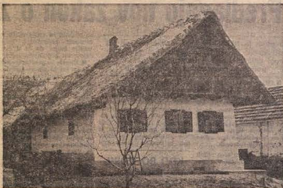
V naših krajih je le še malo tipičnih kmečkih hiš, ki bi lahko privabljal turiste. Izpodrivajo jih nove in netipično obnovljene hiše, ki največkrat kazijo zunanjo podobo naših vasi. Na sliki: tipična kmečka hiša v Slovenskih goricah.

Prizadevati bi si morali, da bi ohranili pristen zunanji videz, zunanjo podobo naše vasi. V nekaterih skandinavskih deželah je še dolgo v veljavi zakon, ki prepoveduje spreminjanje zunanjega videza kmečkih hiš, predvsem pa spreminjanje pročelij kmečkih hiš ob glavnih cestah. Pri nas pa neusmiljeno in največkrat tudi neestetsko spreminjamo posamezne kmečke hiše, pa tudi podobe vasi v celoti. S tem pa je konec tipičnosti naše vasi, naša vas je vse bolj podobna po arhitekturni kvaliteti obratnim predelom naših mest. Ob značilnih podeželskih starih hišah se pojavlja rečna predmestna arhitektura. Ljudje pačijo stoletja oblikovano lepo zunanjo podobo kmečkih hiš, širijo okna in vrata, na Krasu celo podirajo kamnite ograje in čudovito oblikovane kolone z bogatim kamnitim okrasjem. Proti temu