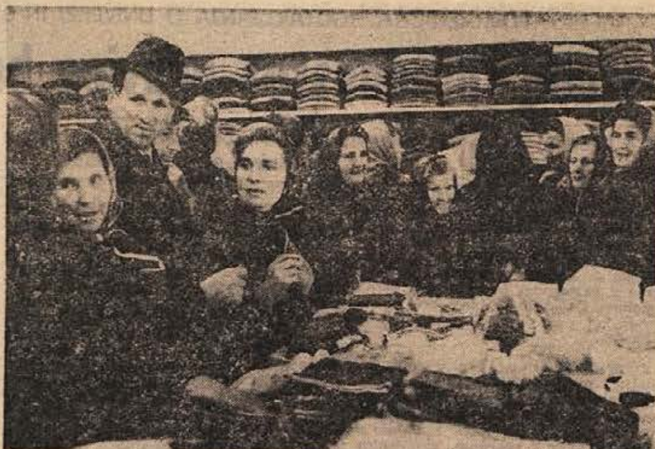
Ob otvoritvi Dolenjke blagovnice v Črnomlju se je trlo ljudi. Občani so hvalili trgovine, zadovoljni pa so bili tudi z veliko izbiro blaga.

Potrošniki, obiščite bogato založeno BLAGOVNICO v Črnomlju!