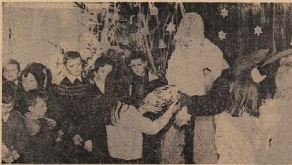
Predstavniki živilskega kombinata ZITO so tudi letos za novo leto obiskali šolarje na Lazah in jih obdarili. Dedeček Mraz je prinesel sladkarije in zvezke, šola pa je dobila zbirko knjig za knjižnico.