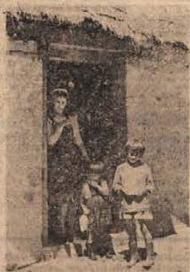
Cimprej v dolino, da rešimo vsaj otroke.

Teško vprašanje je sedaj rešeno. Družina se je preselila v dolino. Življenje jim bo lepše teklo. Otroci bodo prišli v zdravo, razgibano in vedro okolje. Za družbo ne bodo izgubljeni ljudje. Tudi šola bo naredila svoje. Se leto ali dve bivanja v tistih neumljenih hribih bi bilo za male neobgledne verjetno usodno.